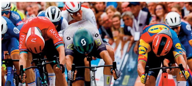
Matteo Moschetti (Q36.5 Pro Cycling Team) a remporté, ce dimanche, le Grand Prix d'Isbergues devant Mads Pedersen et Arnaud Démare.

Matteo Moschetti (Q36.5 Pro Cycling Team) a remporté, ce dimanche, le Grand Prix d'Isbergues, 16 e manche de la coupe de France 2023. L'Italien s'est imposé de justesse au sprint devant Mads Pedersen (Lidl-Trek). Arnaud Démare (Arkéa-Samsic) complète le podium. À 27 ans, Moschetti signe sa deuxième victoire de la saison, après avoir remporté la Clásica de Almería en début de saison.